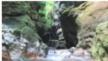
Die Schlucht von hinten

Es war ein sehr schöner Ausflug und super Tauchgang, schade ist die Teilnahme in letzter Zeit so mager.