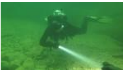
Beim Fische betrachten