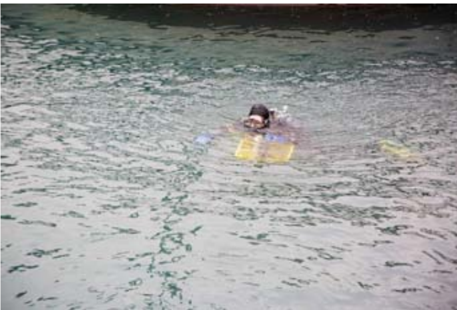
Die Taucher des Tauchclubs Interlaken/Thunersee unterstützen die Aktion seit Jahren.