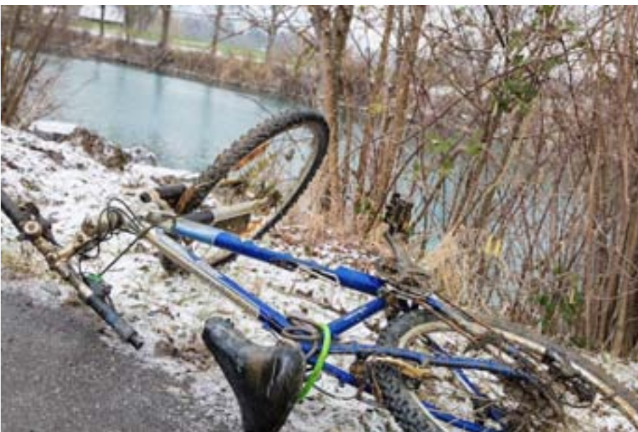
Velos wurden auch in diesem Jahr wieder gefunden, jedoch deutlich weniger als noch vor vier Jahren.