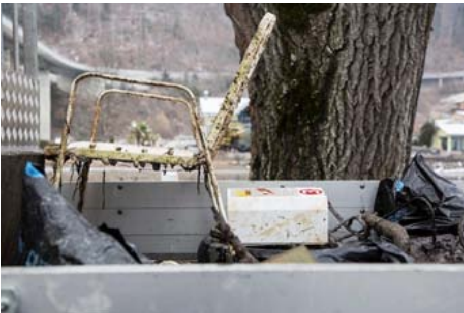
... werden sie auf dem Abfallsammelhof sachgerecht entsorgt.