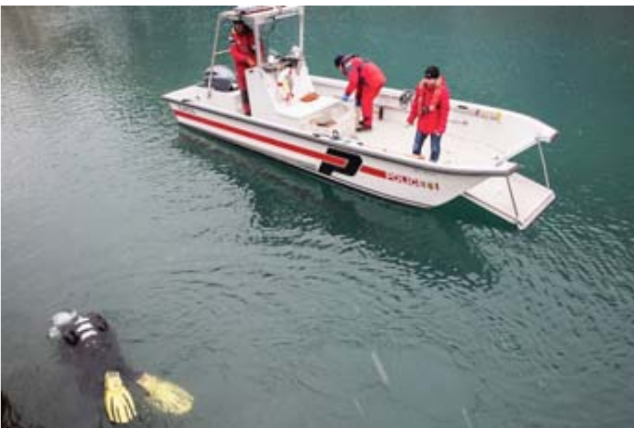
Kleine Boote schwimmen neben den Tauchern mit, um den gefundenen Müll entgegenzunehmen.