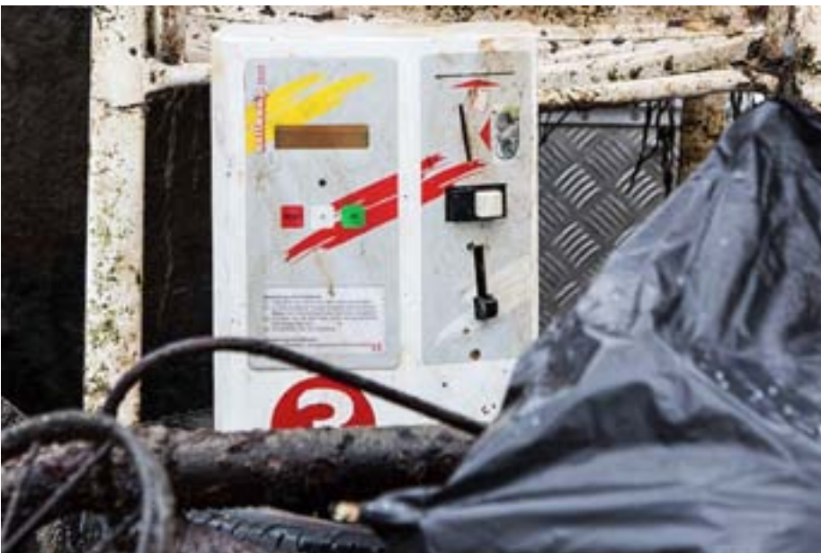
Wie dieser Automat in die Aare kam, kann sich niemand so recht erklären.